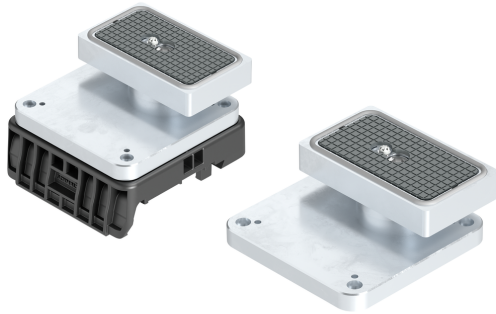
Blocchi di aspirazione VCBL-S6-HD